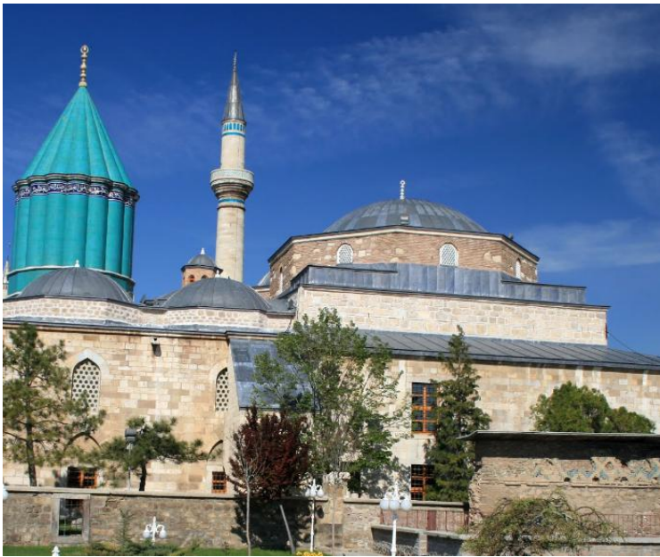
мечеть Алааддина в Конье

Сходство стиля и технико-композиционных приемов декора порталов мечети Алааддина и расположенного напротив медресе Каратай, отмеченные уже при первом знакомстве европейских исследователей с памятниками Анатолии, вызвало предположение о едином авторстве двух порталов и стало основанием для более ранней атрибуции портала медресе. Макс Ван Бершем (van Berchem) в 1913 г. «согласился с тем, что портал Бююк Каратай медресе имеет близкую [порталу мечети Алааддина] дату, хотя и не несет «подписи» мастера 3 . В дальнейшем предположение об авторстве мастера из Дамаска было поддержано рядом исследователей. На основании анализа приведенной в надписи генеалогии правителя М.Роджерс утверждает, что «здание могло быть разрушенным или покинутым султанским учреждением (Royal foundation) в 620-х годах» 4 . Т.Джантай полагает, что медресе было основано в 1220-е годы самим визирем Каратаем: «Источники содержат сведения о том, что основатель (медресе) Джалалад-дин Каратай был одним из эмиров, близких к Алааддину Кейкубаду I уже в 1219 году, в год его вступления на престол, и ещё при Иззеддине Кейкавусе I он находился на государственной службе» 5 .