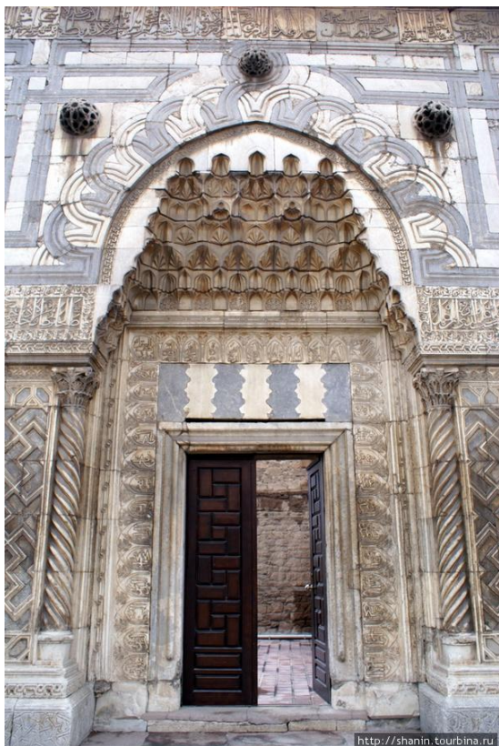
вход в Каратай медресе в Конье

заказчиком столь значимого учреждения, расположенного в непосредственной близости от дворцового комплекса Сельджукидов. Великолепный портал, сложенный из камня и облицованный белым и серым мрамором 6 , словно служит отражением северного портала мечети Алааддина - главной мечети столицы. Однако при внимательном рассмотрении это «отражение» предстаёт как произведение с геометрически четкой композицией, продуманными и дополняющими друг друга элементами декора, воплощенное в виртуозной каменной резьбе. Кроме того, портал демонстрирует зрелость в претворении сирийского наследия, еще не ставшую характеристикой стиля мастера в других памятниках, в которых его авторство подтверждается документально.