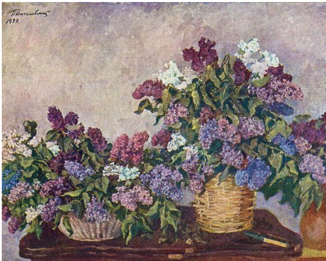
П. Кончаловский «Сирень в корзине», х.м., 1939

Цветы использовали как объект наиболее адекватный выражению радости жизни и полноты бытия (П. Кончаловский)