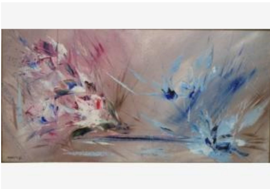
Е.Григорьева «Песня о любви», х.м., 1992