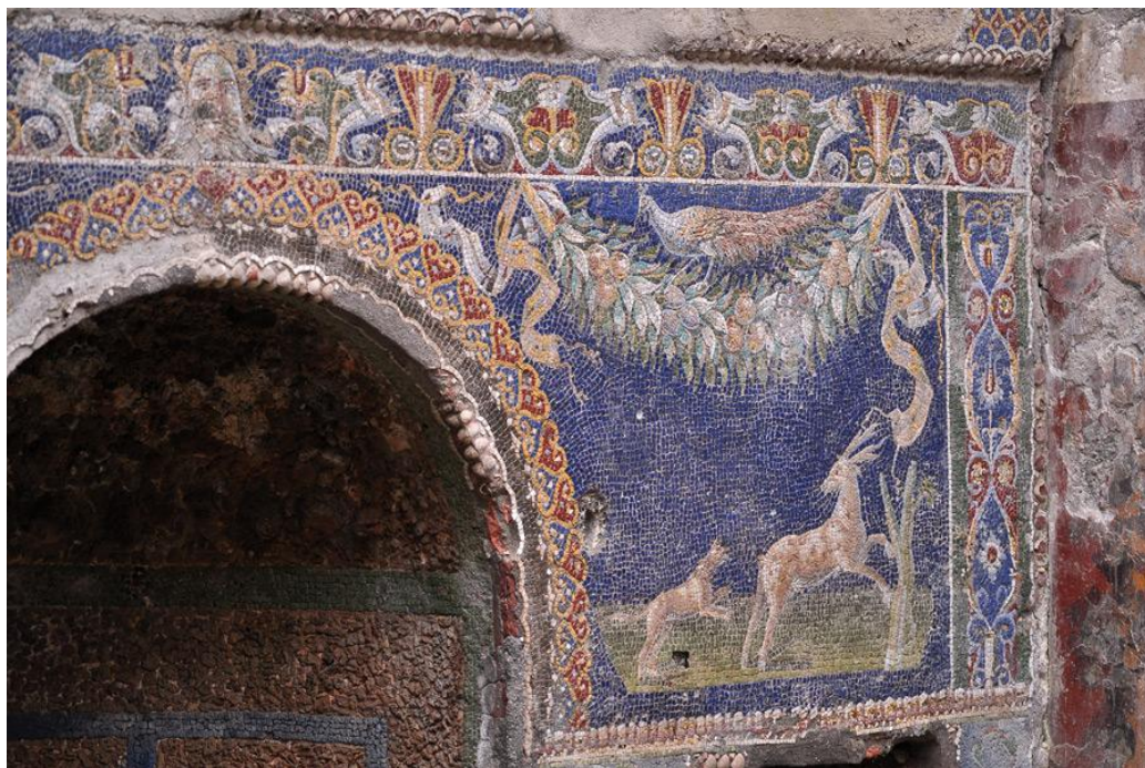
Павлины на гирляндах с цветами и сцены охоты. Геркуланум

Цветы рисовали как великие художники, так и ремесленники от искусства, народные мастера и наивные провидцы. Гиперреалистическое изображение цветов привлекало внимание творцов во все времена – от античности (фрески Помпеи и Геркуланума) до сегодняшнего дня.